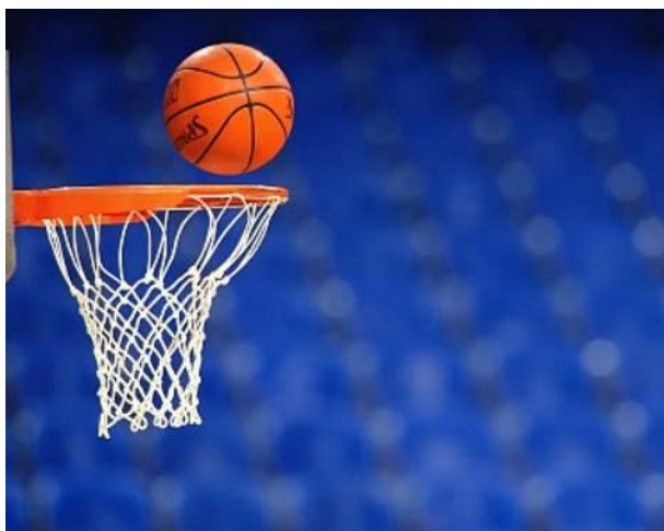
L'équipe Jeunes du BCM