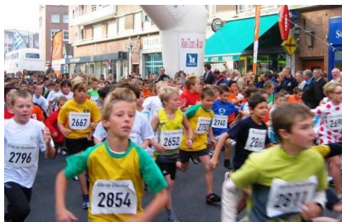
Boucles Dunkerquoises, 4 207 coureurs enfants et adultes